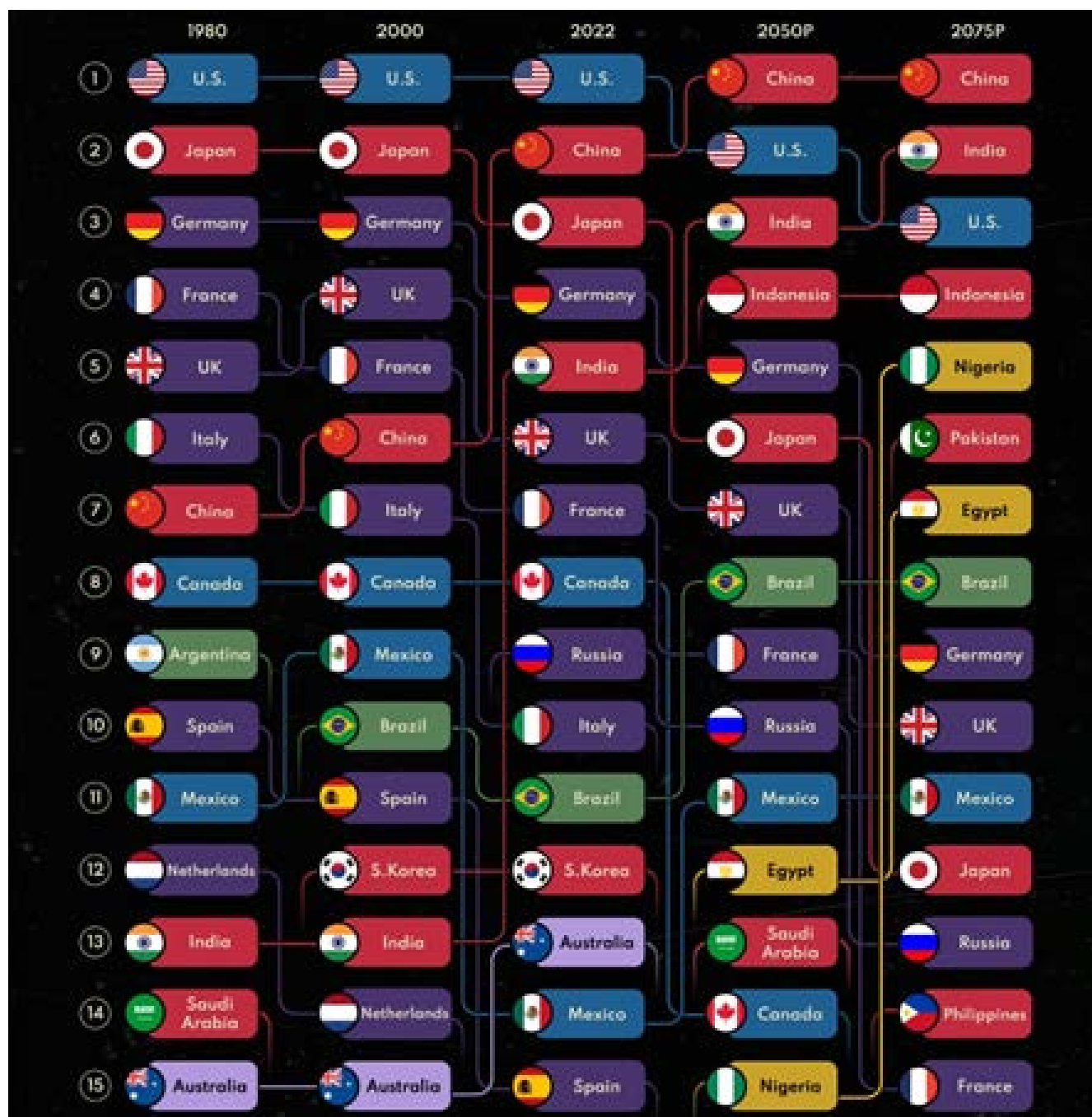
Fig. No. 1. Trayectoria económica de las 15 principales economías a nivel mundial de 1980 al 2075 (proyección basada en el PIB real 2021 USD)